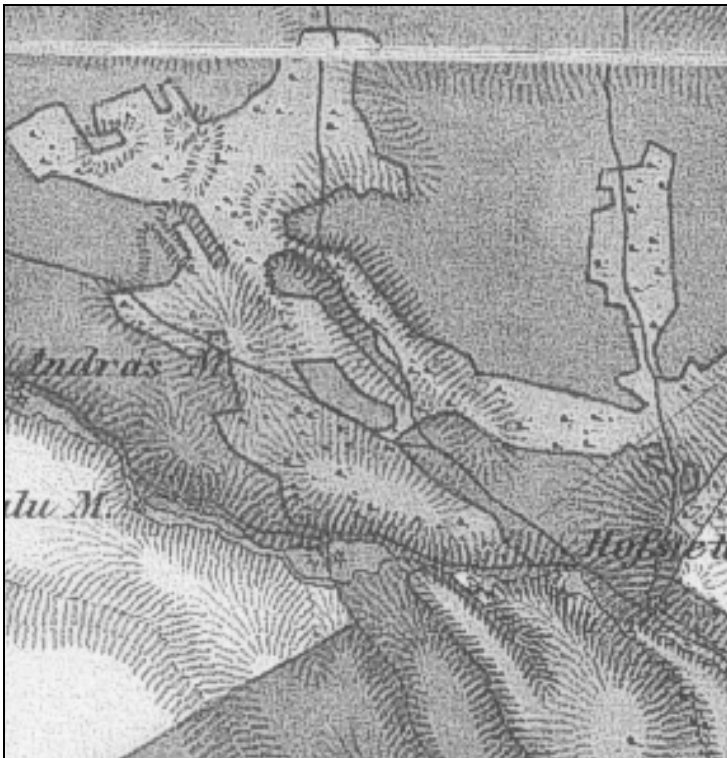
Kinagyított részlet a II. katonai felmérés térképszelvényéről [B2-2].

Az Elpusztult malomnak (Wöller István tanulmányában Fekete M. malom) nincs vízikönyve a levéltárban. Létezésére csak alsó és felső szomszédainak vízikönyvi dokumentumai utalnak, illetve a második katonai felmérés térképén látható, név nélkül jelölve [B2-1].