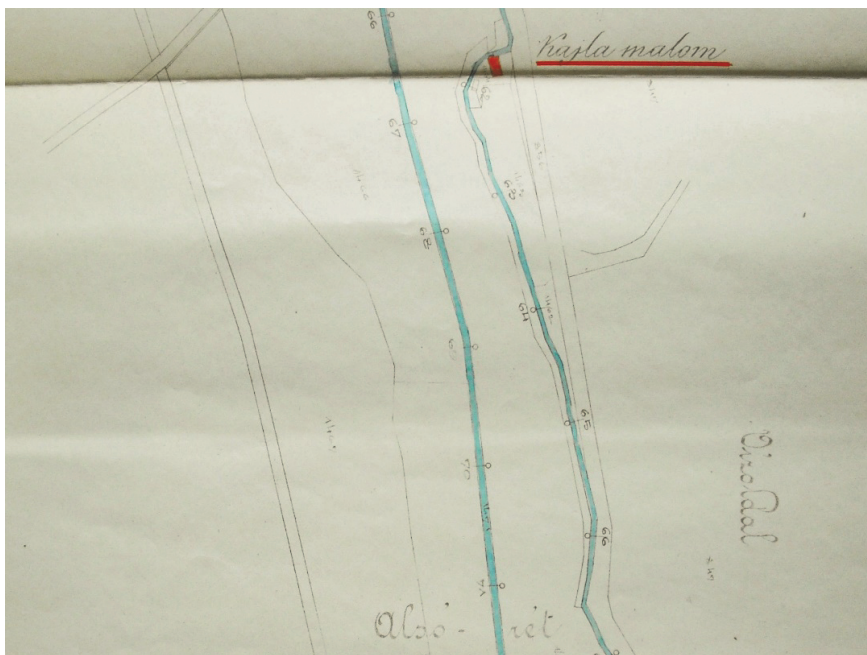
Helyszínrajz – részlet (a Kajla malom épületének pirossal jelölt része kiemelés a szerzőtől)