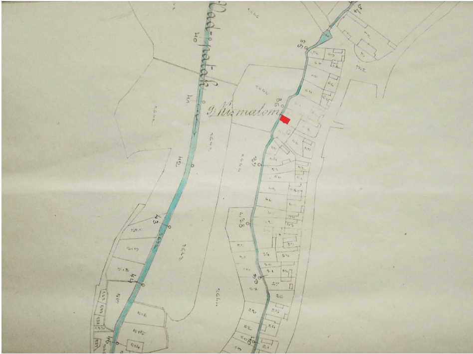
Helyszínrajz – részlet (a Kis malom épületének pirossal jelölt része kímelés a szerzőtől)

[Sály-1] http://motka.gyor.hu/file/atch/137/s1-01.jpg